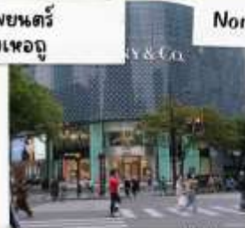
ถนนคนเดินหวยไห่