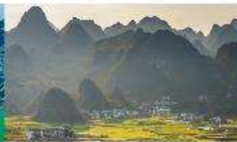
ป่าภูเขามื่นยอด