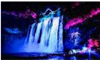
อุทยานน้ำตกหวงโก๋ซู่