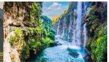
ชุมชนน้ำตกร้อยสายหม่าหลิงเหอ

*ทางบริษัทฯ ขอสงวนสิทธิ์ในการสลับโปรแกรมทัวร์ตามความเหมาะสมขึ้นอยู่กับสถานการณ์หน้างาน โดยคำนึงถึงผลประโยชน์ของลูกค้าเป็นสำคัญ