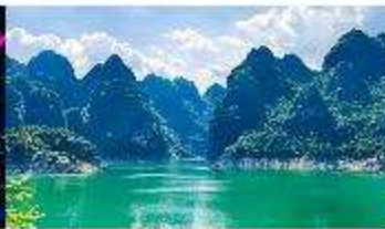
ทะเลสาบวันฟงหู