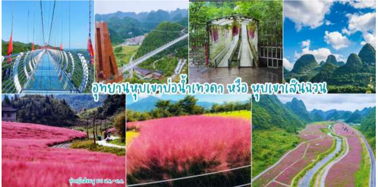
อุทยานหุบเขาบ่อน้ำเทวดา หรือ หุบเขาเสินฉวน

เช้า |๑|รับประทานอาหารเช้า ณ ห้องอาหารของโรงแรม