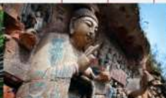
ผาศินแกะสลักต้าจู้ เขาเป่าตึงซาน