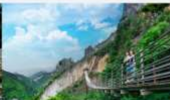
หุบเขารอยแยกอุ๋หลิงซาน