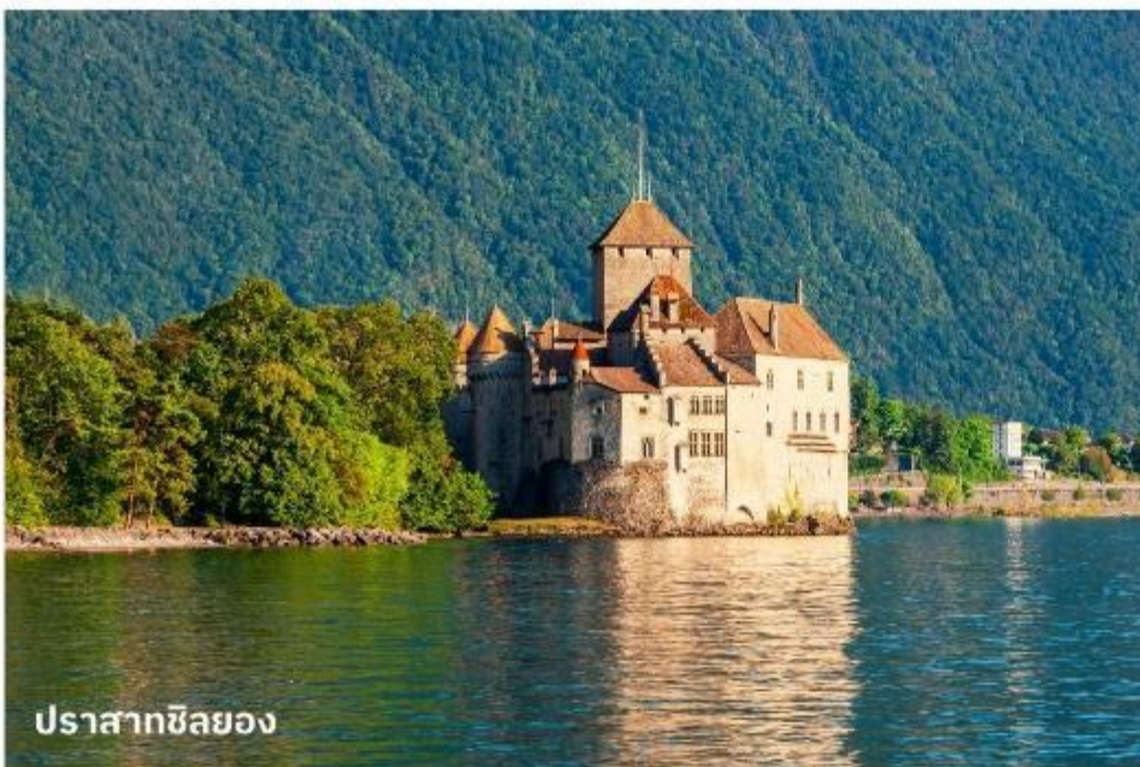
ปราสาทซิลยอง