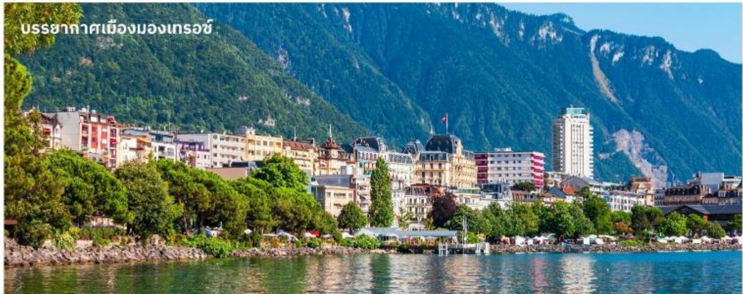
บรรยากาศเมืองมงเทรอร์ช

จากนั้นนำท่านเดินทางสู่ เมืองแทสซ์ (Tasch) ด้วยรถไฟ และเดินทางด้วยรถบัสต่อไปยัง เมืองมงเทรอร์ช (Montreux) ใช้เวลาเดินทางประมาณ 2 ชั่วโมง เมืองตากอากาศที่ตั้งอยู่ริมทะเลสาบเจนีวา ได้ชื่อว่าเป็นริเวียร่าของสวิส ชมความสวยงามของทิวทัศน์ บ้านเรือน ริมทะเลสาบ นำท่านถ่ายรูปด้านหน้า ปราสาทซิลยอง (Chillon castle) ปราสาทโบราณอายุกว่า 800 ปี สร้างขึ้นบนเกาะหินริมทะเลสาบเจนีวา ตั้งแต่ยุคโรมันเรื่องอำนาจโดยราชวงศ์ SAVOY โดยมีจุดมุ่งหมายเพื่อควบคุมการเดินทางของนักเดินทางและขบวนสินค้าที่จะสัญจรผ่านไปมาจากเหนือสู่ใต้หรือจากตะวันตกสู่ตะวันออกของสวิตเซอร์แลนด์ เนื่องจากเป็นเส้นทางเดียวที่ไม่ต้องเดินทางข้ามเทือกเขาสูงชัน ปราสาทแห่งนี้จึงเปรียบเสมือนด่านเก็บภาษีซึ่งเอาเปรียบชาวสวิสมานานนับร้อยปี