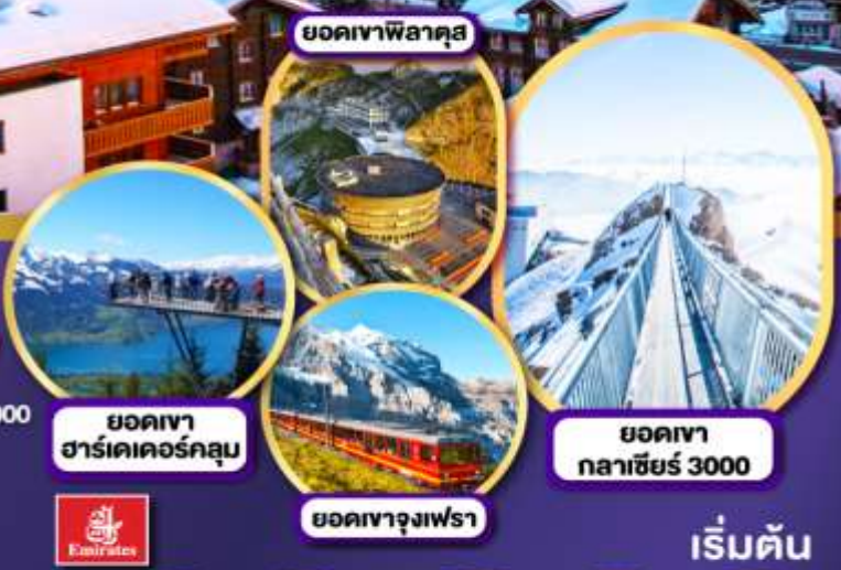
ยอดเขาพลาตัส