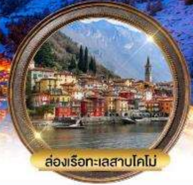
ล่องเรือทะเลสาบโคโม