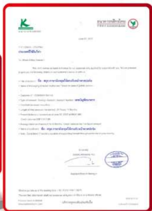
ตัวอย่าง Bank Guarantee ที่ผู้สมัครต้องยื่นขอธนาคาร