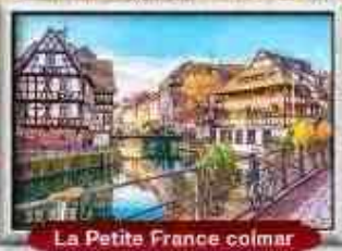
La Petite France colmar

บินหรู สายการบิน Full Service | พิเศษ! หอยแอสคาโก้ อาหาร : 17 มื้อ โรงแรม : 4 ดาว