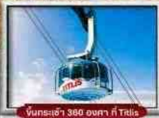
ขึ้นกระเช้า 360 องศา ที่ Talis