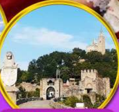
ป้อมชาเรเวทส์