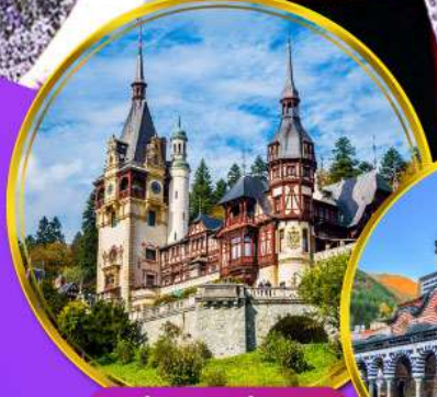
ปราสาทเปเลส