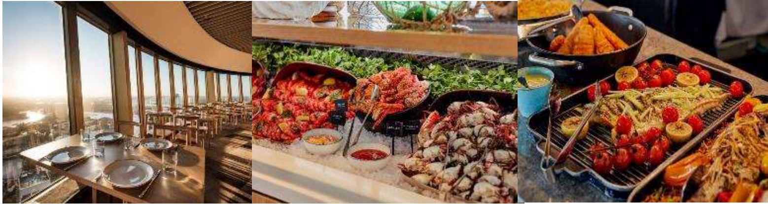
* รูปเพื่อการโฆษณาเท่านั้น *

นำท่านขึ้นหอคอยซิดนีย์ พร้อมรับประทานอาหารบุฟเฟ่ต์นานาชาติ SKYFEAST AT SYDNEY TOWER RESTAURANT พร้อมชมวิวมุมสูงของนครซิดนีย์