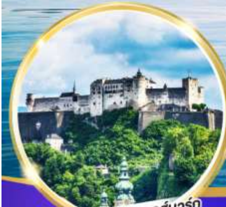
ปราสาทโฮเฮนชวานส์บวร์ค