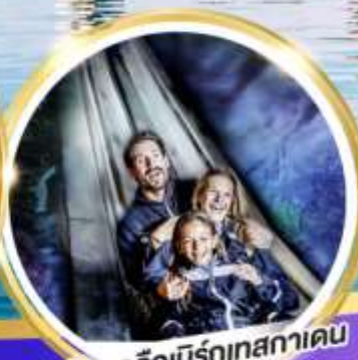
เหมืองเกลือบิรท์เทสกาเดิน